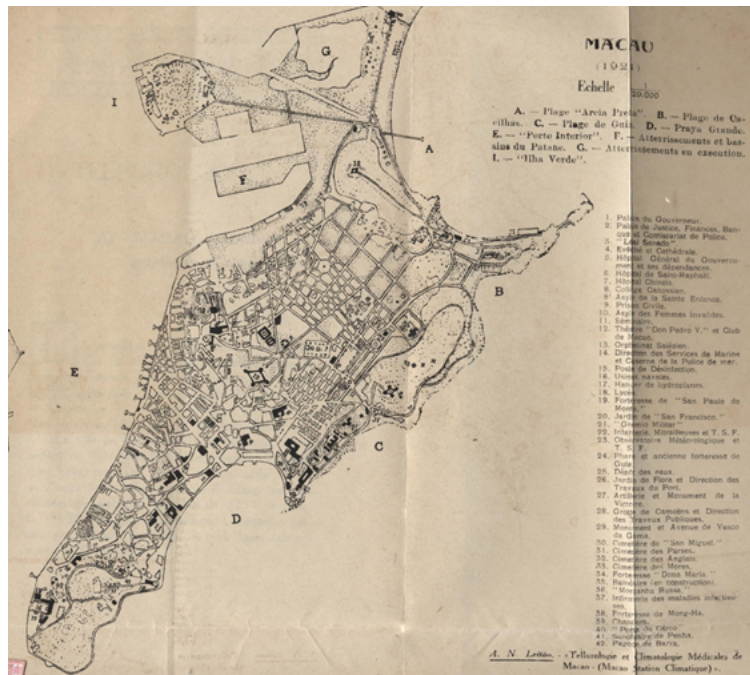
Map of Macau, 1921 [Macau, 1921, Extr.]