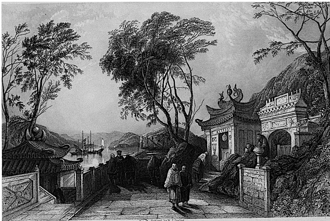
I, 68: Chapel of the Great Temple of Macao [Chapelle du Grand Temple à Macao]