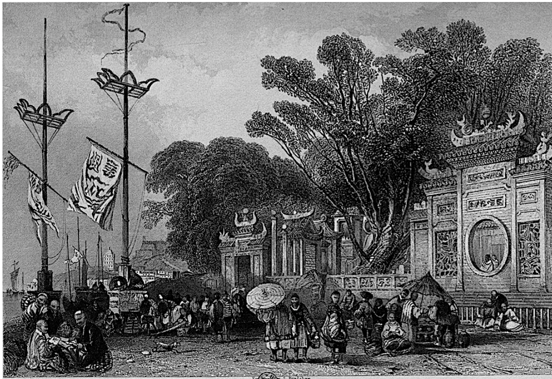
I, 67: Facade of the Great Temple in Macao [Façade du Grand Temple à Macao]