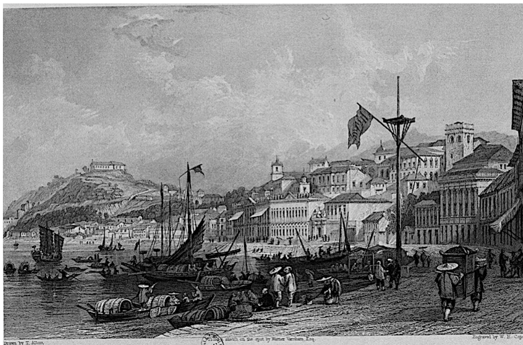
II, 31: 'Praia Grande' in Macao [Playa Grande à Macao]