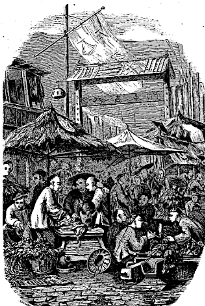
Marché à Macao.