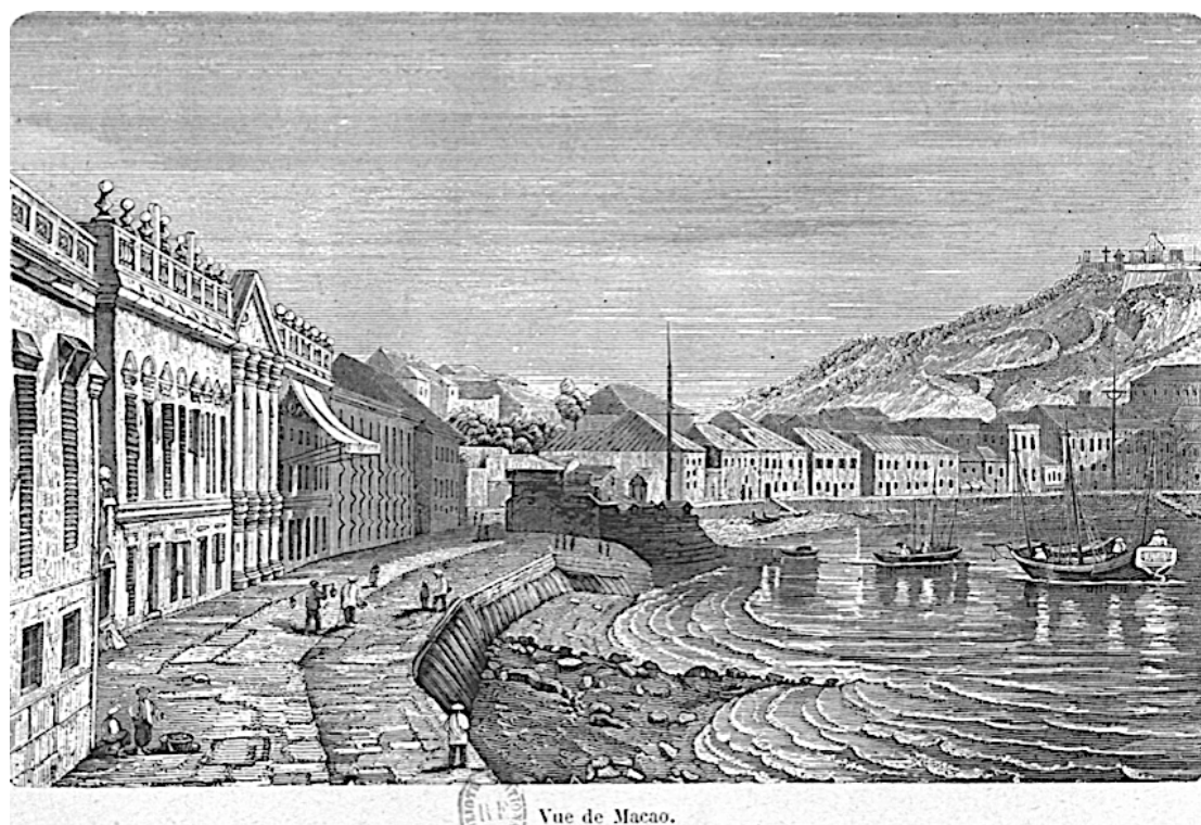
Vue de Macao.

Département Philosophie, histoire, sciences de l'homme, 8-O2N-761